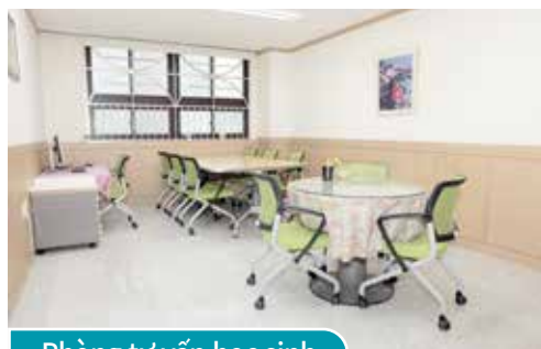
Phòng tư vấn học sinh

Nhằm mục đích hiệu quả hóa nền giáo dục của trường học bằng cách tăng cường bảo vệ, duy trì sức khỏe của học sinh, giáo viên và nhân viên trong trường.