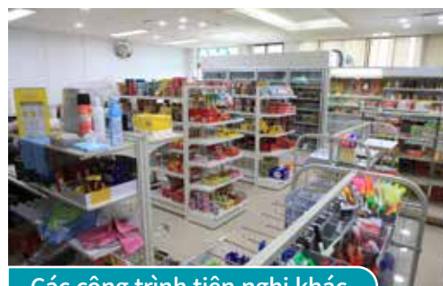
Các công trình tiện nghi khác

Mục đích nâng cao hiệu quả công việc, giáo dục bằng cách cung cấp dịch vụ chất lượng cao và đồ ăn uống giá rẻ, ngoài ra còn là không gian nghỉ ngơi của học sinh và nhân viên trong trường.