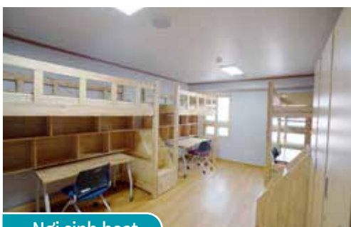
Nơi sinh hoạt

Trong quá trình học tập, hỗ trợ và giúp đỡ giải quyết các vấn đề khó khăn của cá nhân học sinh hay những xung đột, thông qua đó giúp các bạn nhìn nhận vấn đề một cách khách quan, mở rộng sự tiếp thu và hiểu thêm về bản thân.