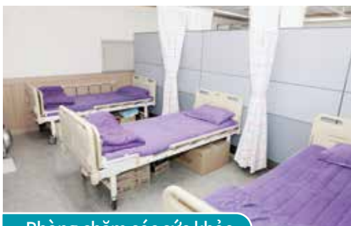
Phòng chăm sóc sức khỏe

Nhằm mục đích hiệu quả hóa nền giáo dục của trường học bằng cách tăng cường bảo vệ, duy trì sức khỏe của học sinh, giáo viên và nhân viên trong trường.