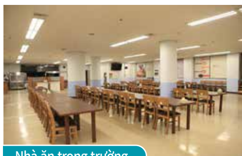
Nhà ăn trong trường

Cung cấp bữa ăn dinh dưỡng, an toàn cho học sinh, giáo viên và nhân viên trong trường.